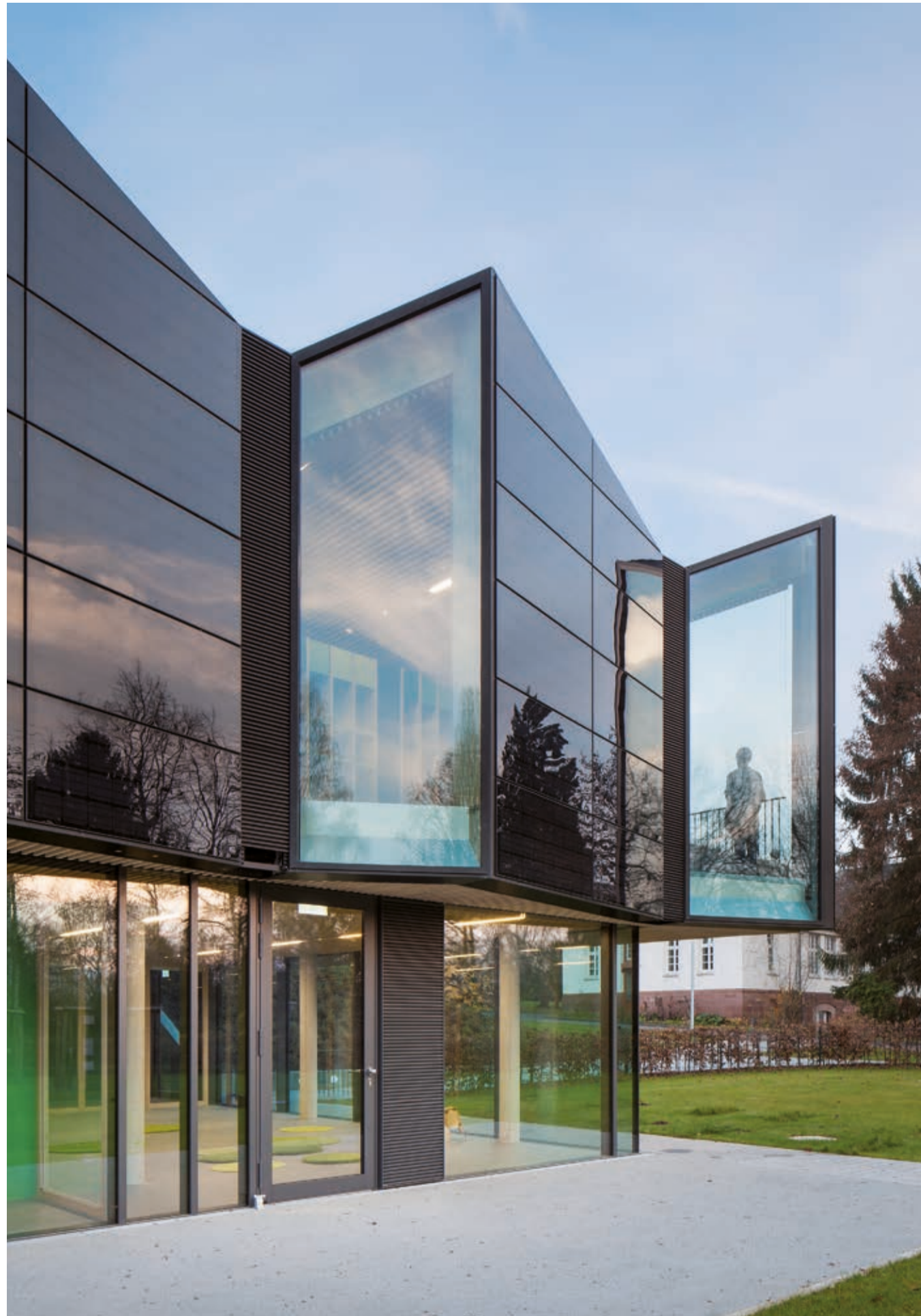
Im Sinne eines Pavillons im Park bezieht sich der Entwurf in vielfacher Hinsicht auf die umgebende Landschaft. Die umlaufend raumhohen Fenster erlauben einen unverstellten Blick auf den Park und spiegeln, genauso wie die Module, die Landschaft wider und lassen Innen- und Außenraum ineinanderfließen.