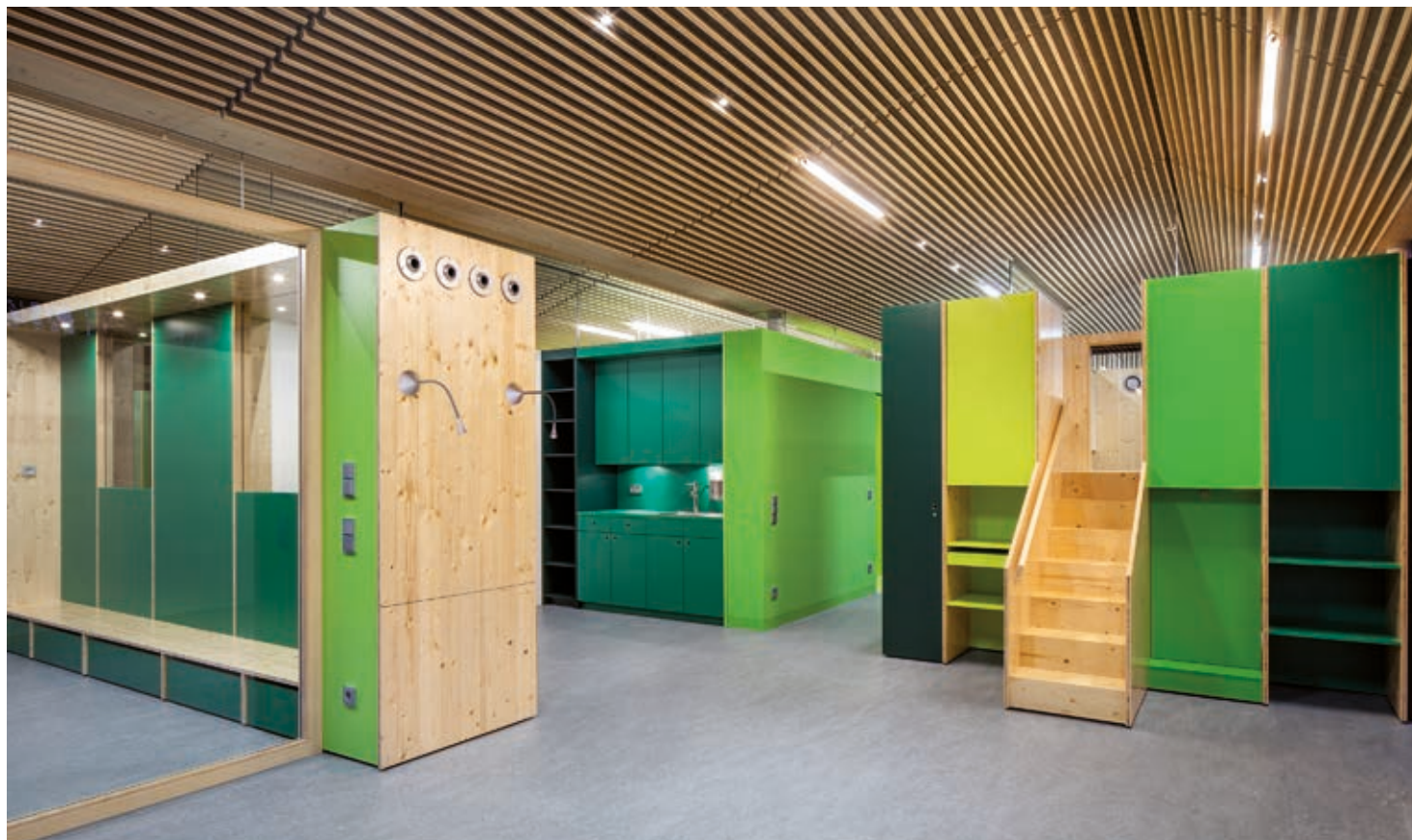
In Anlehnung an die grüne, dicht mit Bäumen besiedelte Parklandschaft wurden die Räume und Möbel aus Fichte-Dreischichtplatten gefertigt und in einer variierenden Palette von Grüntönen beschichtet.

Stadtentwicklung für die Kindertagesstätte adaptiert wurde. Der Standard berücksichtigt neben den Energiebedarfen für den Gebäudebetrieb nach DIN 18599 (Heizen, Kühlen, Lüften, Warmwasser, Beleuchtung) auch den Energiebedarf der Nutzung und strebt eine positive Energiebilanz für die End- als auch die Primärenergie des Gebäudes über das Jahr an. Um einen solch hohen energetischen Standard erreichen zu können, mussten im Entwurf zunächst die Energiebedarfe gesenkt werden. Für die grundlegende Senkung des Energiebedarfs wurde schon im Entwurf auf einen kompakten Baukörper und eine optimierte Orientierung der transparenten Flächen geachtet.