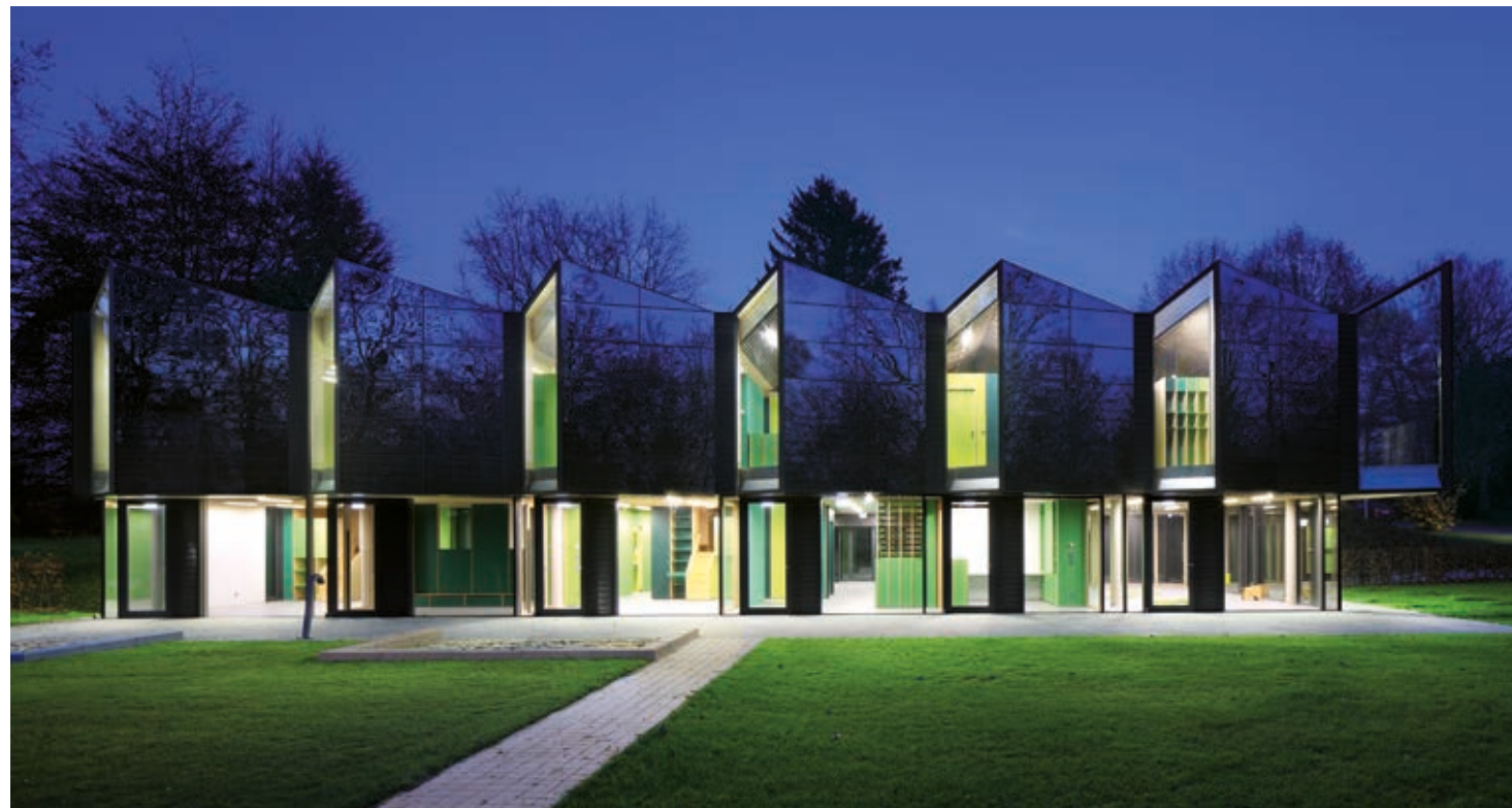
Um den Plusenergiestandard zu erreichen, wurden die Dachflächen und die südwestliche Fassade im Obergeschoss aktiv für Fotovoltaik herangezogen. Die Solarmodule wurden dabei nicht wie herkömmlich additiv aufgesetzt, sondern als gestaltbildender Teil der Gebäudehülle verwendet.